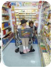
『あと何を 買うんだっけ?』