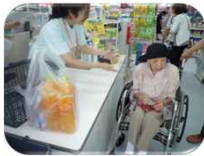
『私はどうしたらいいの?』