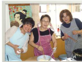
入居者様の娘さんと職員