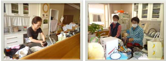
入居者様の娘さん